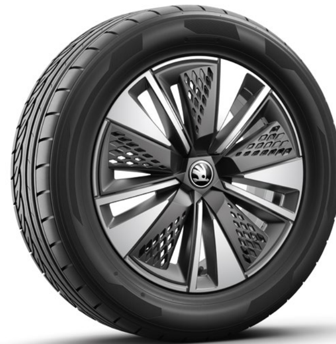
17" Scutus Aero antraciet gepolijst