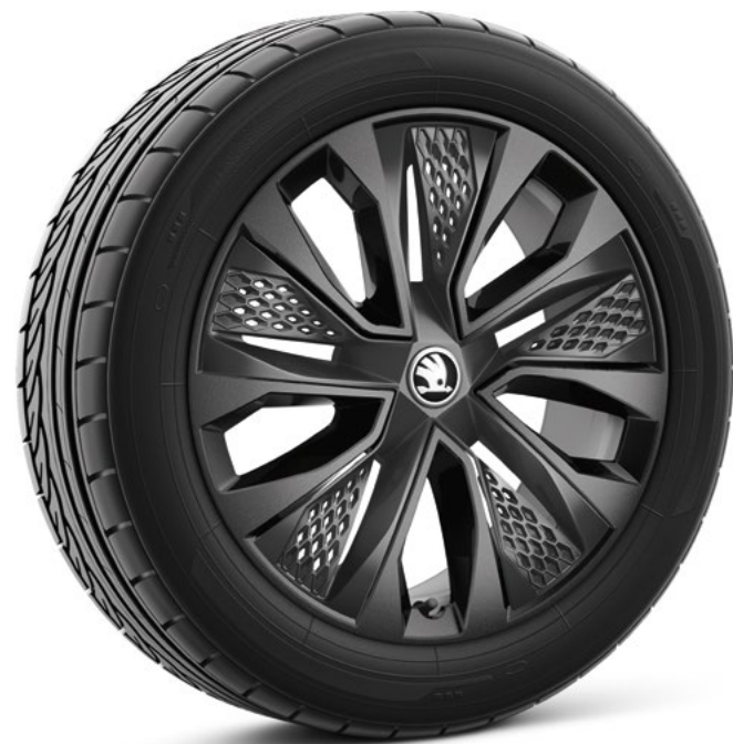
18" Procyon Aero zwart