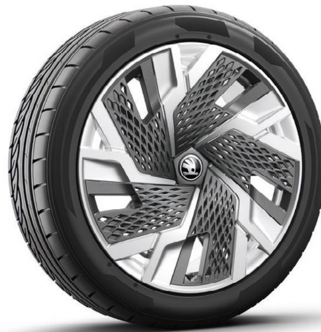
19" Sagitarius Aero antraciet gepolijst