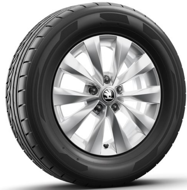
16" Castor zilver