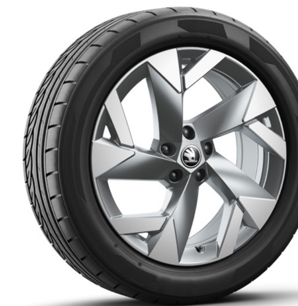
19" Tirsuli aero, antraciet