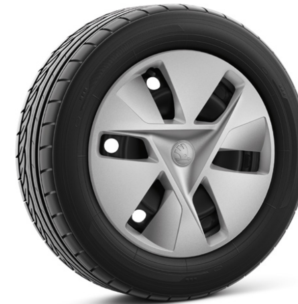
17" Guan zilver