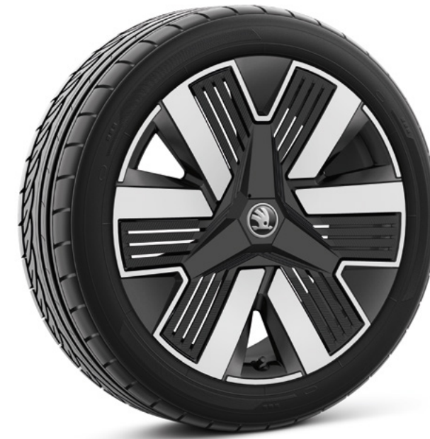
19" Lark zilver/zwart