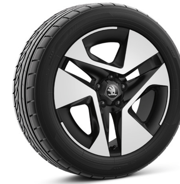
18" Saola zilver/zwart