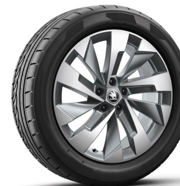
19" Halti aero, antraciet