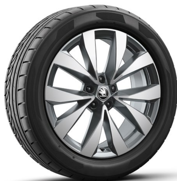
19" Lefka aero, zilver